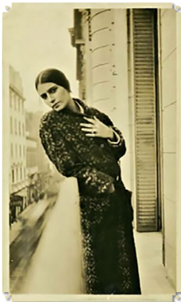
En Montevideo, en 1933